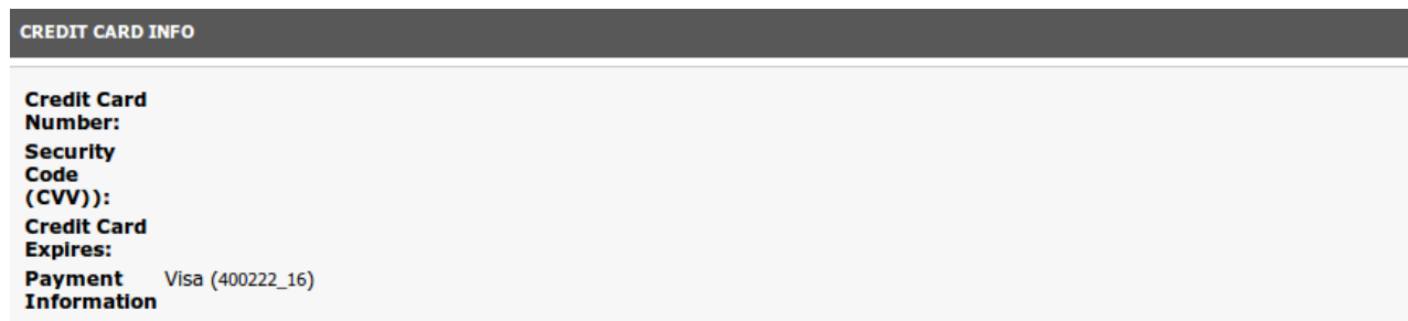
Abbildung 6.1: Transaktionsinformationen

In der Folge finden Sie eine Übersicht über die wichtigsten Funktionen im täglichen Gebrauch des TeleCash Moduls.