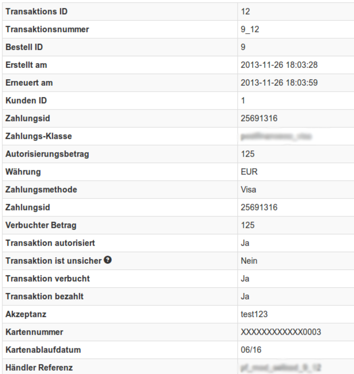
Abbildung 6.1: Transaktionsinformationen.